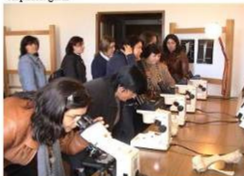
Alunos Curso de Educação e Formação Adultos (EFA's)