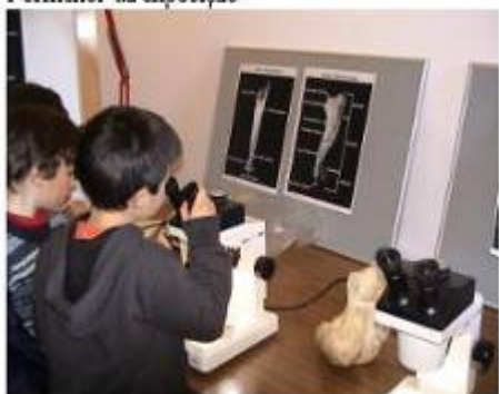
Observações à Lupa Binocular