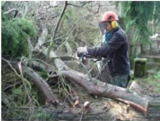
CEFS Operações Florestais