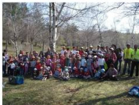
Dia Mundial da Floresta