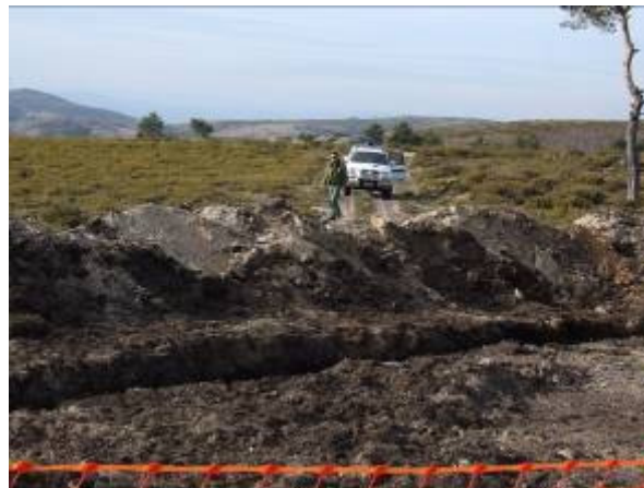
Fotos - Fiscalização de Obras

O resultado destas diligências saldou-se pelo levantamento de 21 autos de Notícia.