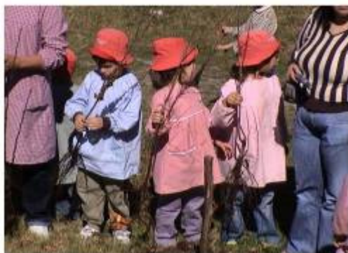
Alunos do Pré-escolar

Sendo actividades na sua maioria promovidas por outras entidades, o PNAI como parceiro desenvolveu uma série de iniciativas devidamente enquadradas, pelo que nestes casos dificilmente se consegue contabilizar a quantidade de participantes.