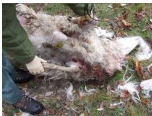
Fotos - Fiscalização de prejuízos de Lobo