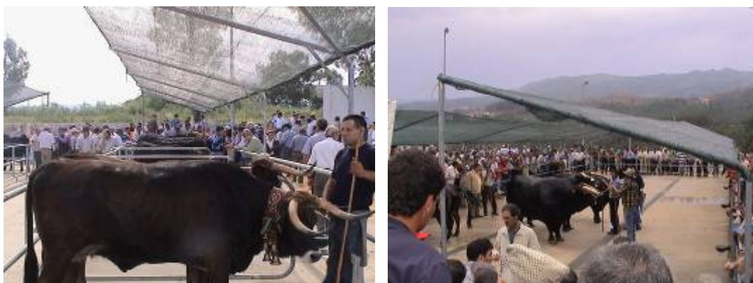
Fotos dos concursos pecuários

Cerca de uma centena de produtores participaram nestas actividades, promovendo a raça e o espaço rural.