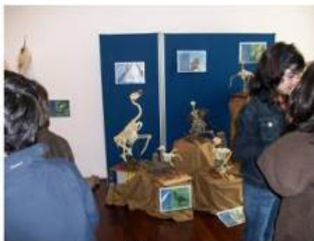
Pormenor da exposição

O total de visitantes às exposições temporárias realizadas no PNAL cifra-se em 7670 visitantes no entanto houve escolas que participaram em ateliers temáticos e que naturalmente também visitavam as exposições, no entanto não aparecem aqui contabilizados.