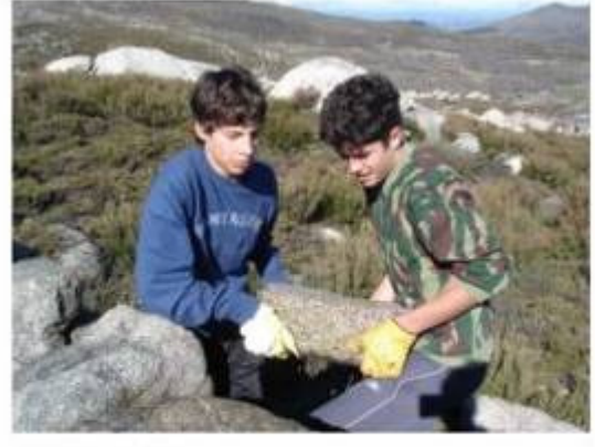
Colégio de Poiares