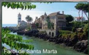
Farol de Santa Marta