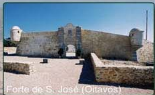
Forte de S. José (Oitavos)