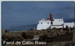
Farol de Cabo Raso