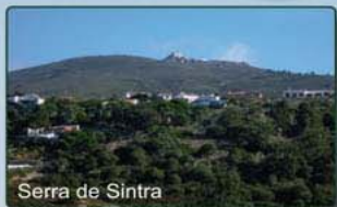
Serra de Sintra

Concelho de Cascais - Troço do Cabo Raso